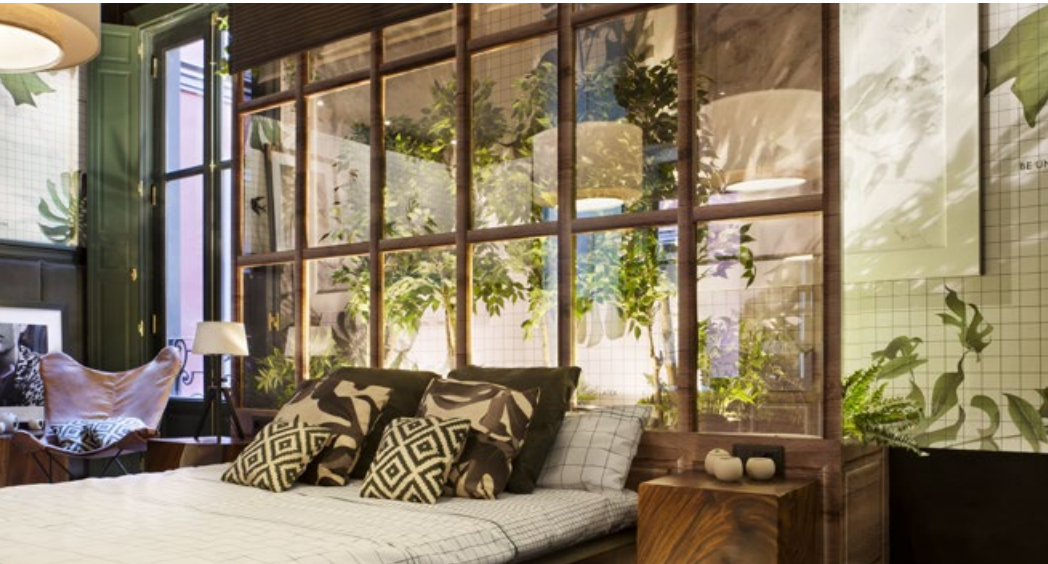
Espacio Kleenex, EGUE y SETA - CASA DECOR 2016