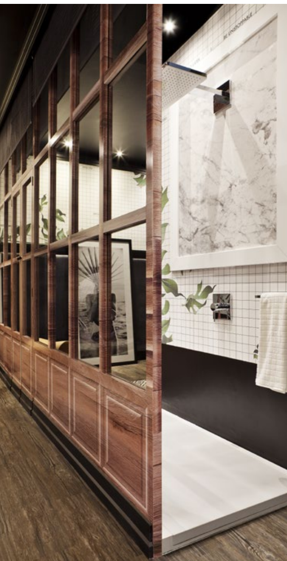
Espacio Kleenex, EGUE y SETA – CASA DECOR 2016